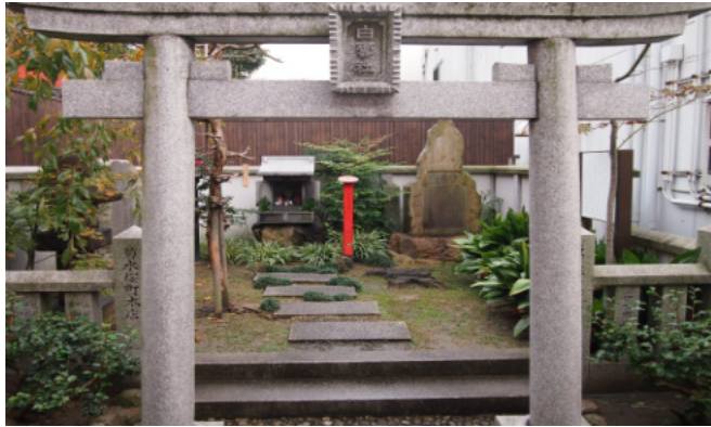
碑の文面は次の通りです。

桜町の白雲通りの中ほどに、石の鳥居が目立つ小さなお社があります。白雲社といいます。この白雲社にある、「白雲櫻碑」についてお話しいたします。下の写真、中央右寄り、自然石に刻まれているのが白雲櫻碑です。