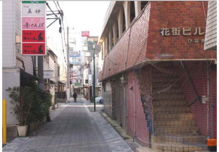
右手、伊川氏の話に出てくる「花街ビル」、現在は閉鎖 中央の小路が「銀座横丁」、伊川氏の話では小川だった

これは、相当な面積、戸数を想像させる表現です。「呉錦堂を語る会」の会員として欣喜雀躍、法務局で調べ、整理したのが「桜町土地取得明細」です。